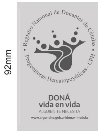
Modelo jarro térmico