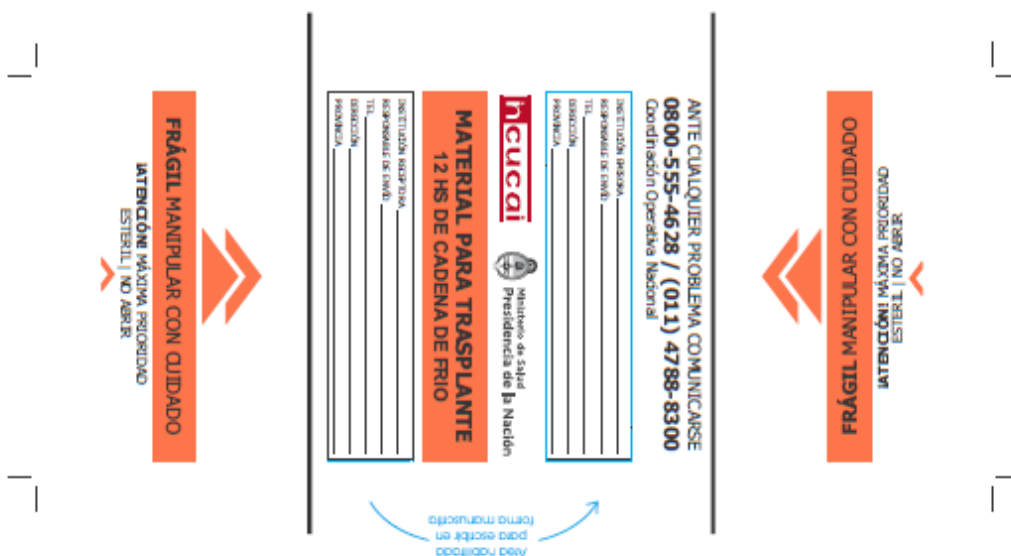
Muestra calco chico