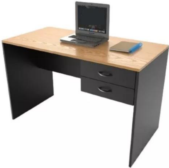
Imagen de referencia para renglón N°4