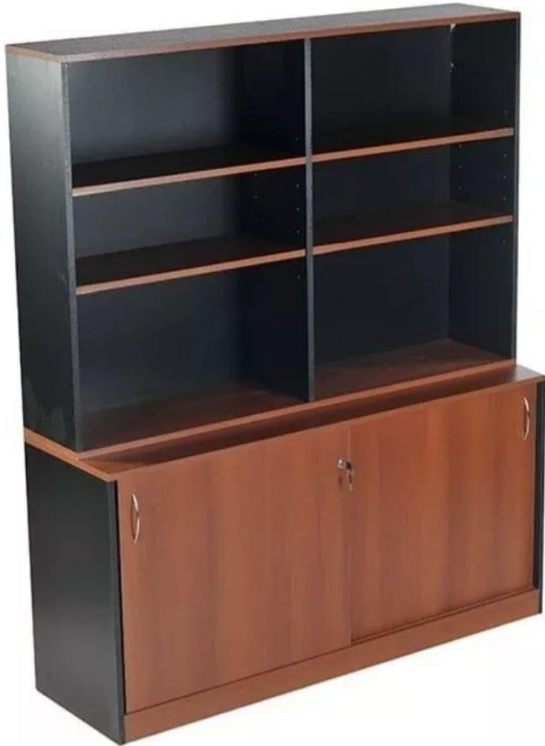
Imagen de referencia para renglón N°1.