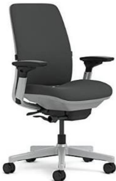
Imagen de referencia para renglón N°2.