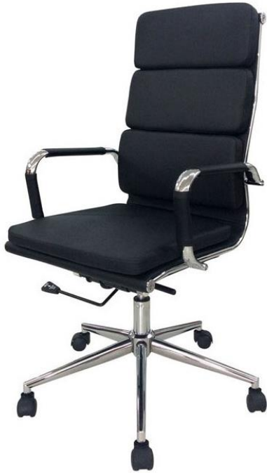
Imagen de referencia para renglón N°3.