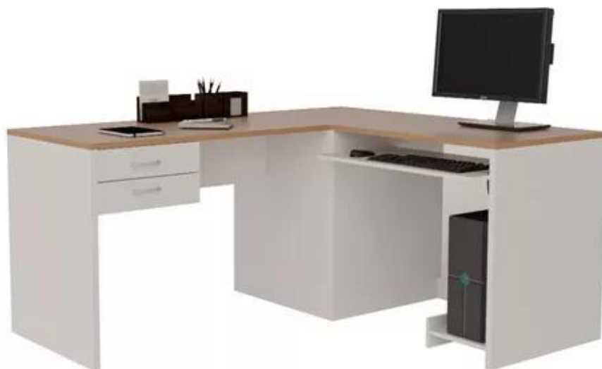
Imagen de referencia para renglón N°5